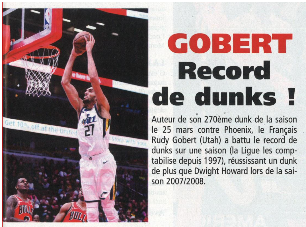
Basket France N°9 – Mai/juin/juillet 2019