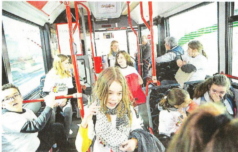
Le Rallye apprend aux enfants à prendre le bus.