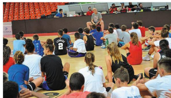
Cholet, la Meilleraie, mardi 23 juillet. Une centaine de jeunes ont écouté les conseils du coach, légende de son sport en Turquie.

Depuis le dimanche 21 et jusqu'au vendredi 26 juillet, c'est au tour du