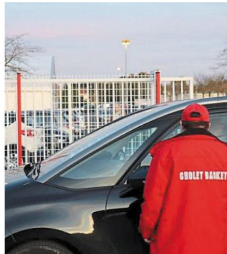
Fidèle au poste, Yvon Godard filtre l'accès au parking VIP.

Certains conducteurs tenteront de dénicher une des rares places restantes. D'autres, moins aventureux, opteront pour le bord de la route un peu plus loin. « Les gens rouspètent un peu , ajoute Yvon Godard, mais on