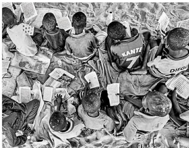
Des enfants sénégalais envoyés par leur famille dans des écoles coraniques.