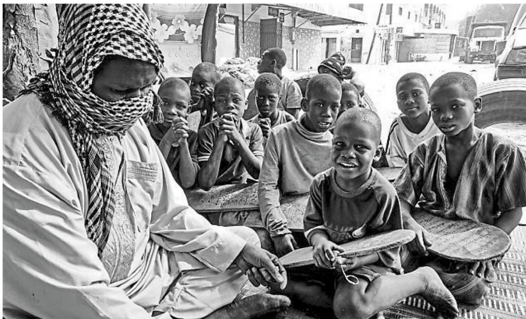
Voici une photo de la série sur les écoles coraniques au Sénégal, signée Alain Martineau, lauréat du prestigieux prix Master Qep.