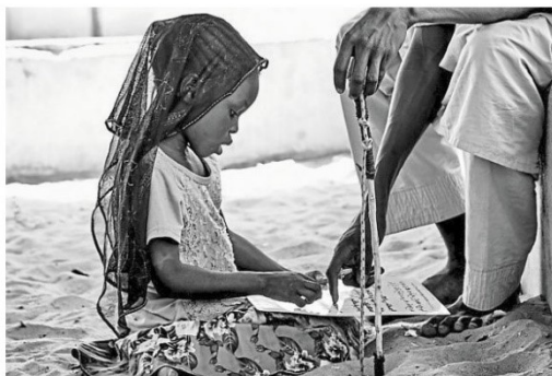
« A la fin, ils doivent réciter le Coran par cœur. »