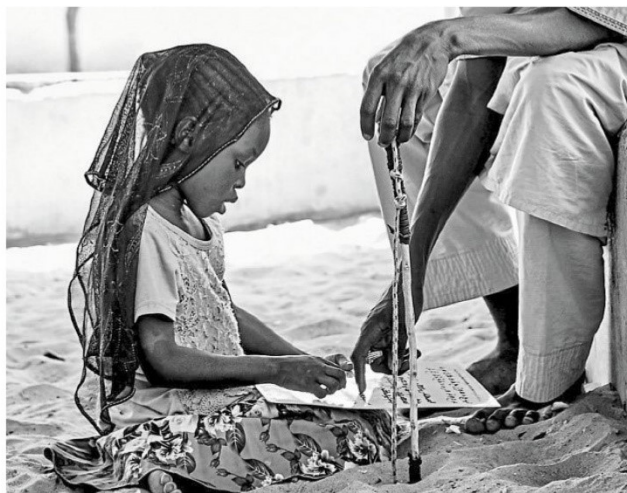
C'est grâce à sa série sur le Sénégal que le photographe a reçu un prix européen.