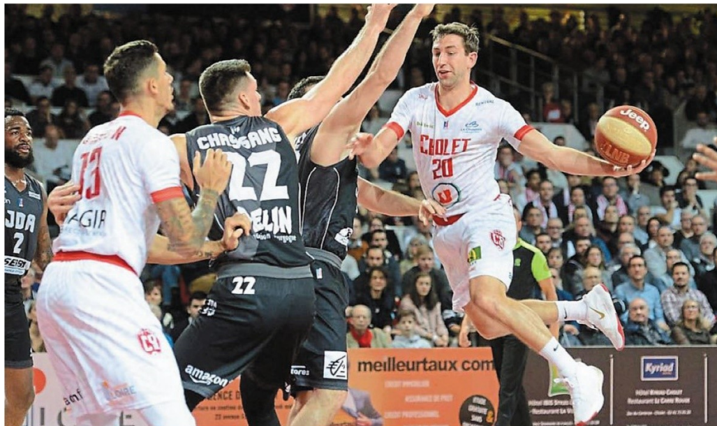
Karaman (à gauche) n'a pas réussi à pallier l'absence d'Horton. Hier soir, Stockton était orphelin de son pivot, à la Meillerie.

« C'était un match intense, dur, défensif. On avait un peu plus de pres-