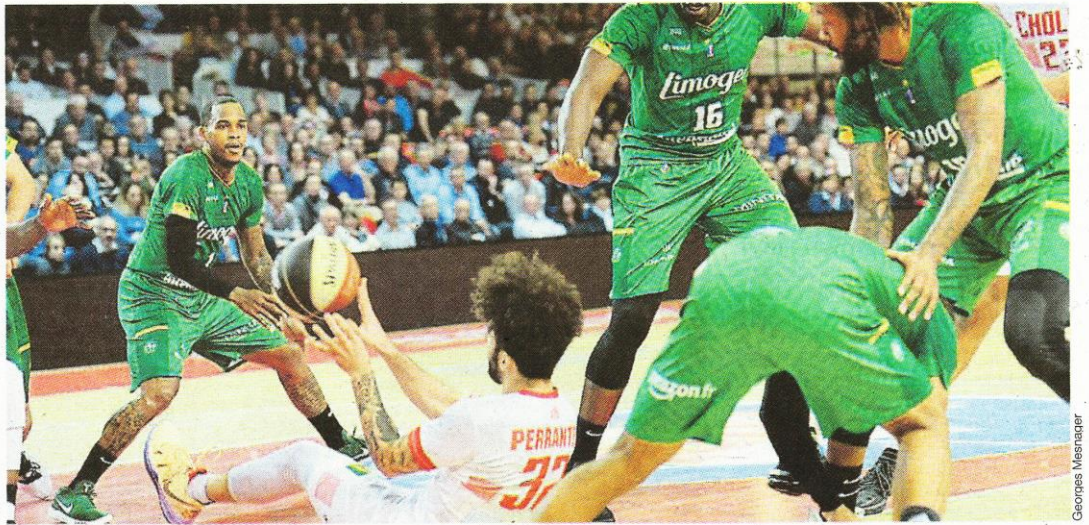
London Perrantes est en bien mauvaise posture, comme les Choletais en ce moment au classement.

Comment ? En regardant jouer le duo Taylor - Hardy, qui a survolé les débats sur la base arrière. Hayes et Ndoye ont