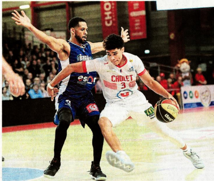
Killian Hayes et Cholet réussiront-ils à surprendre Pau dans sa salle ?

En leurs absences, Pau a souffert, semblant chercher un second souffle, et bataille aujourd'hui pour demeurer dans le top 4. L'Élan s'im-