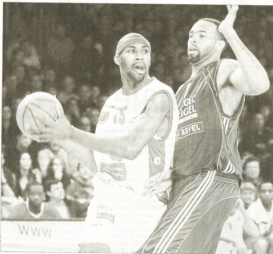
Privée de Ball, mais avec Wilson, les Choletais veulent renouer avec le succès en Bretagne.

Ensuite, l'Étendard, malgré tous ses soucis, paraît relever la tête depuis le retour au club de