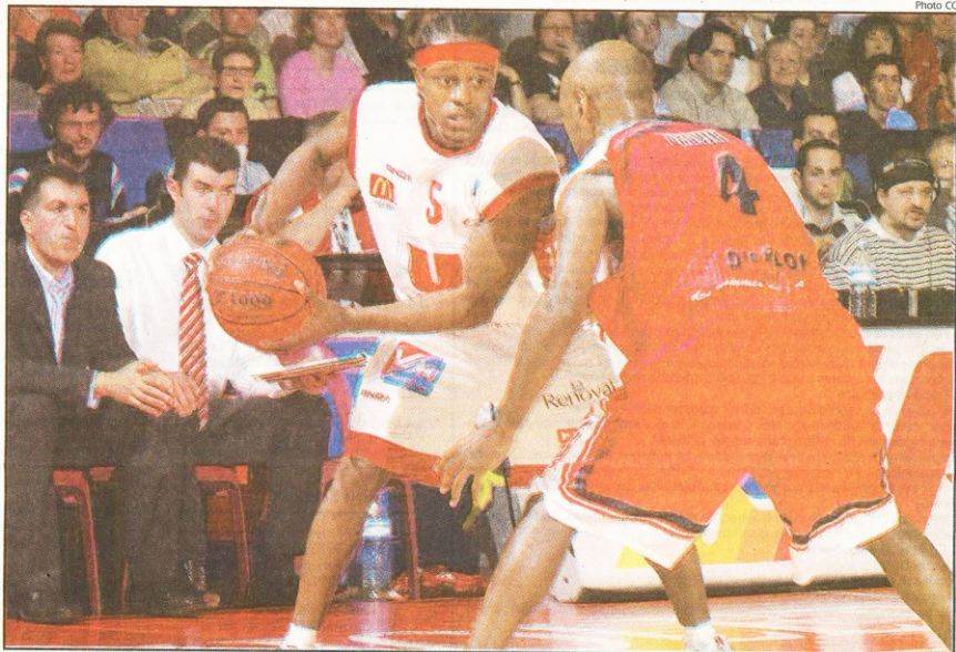
Ball et les Choletais vont être mis à rude épreuve ce soir à Roanne qui veut également s'assurer une bonne place dans le play-off

l'ambition première des Choletais qui restent sur trois rencontres pas vraiment convaincantes même s'ils ont renoué avec la victoire mardi devant Reims. « Ce n'était pas notre meilleur match de la saison mais il