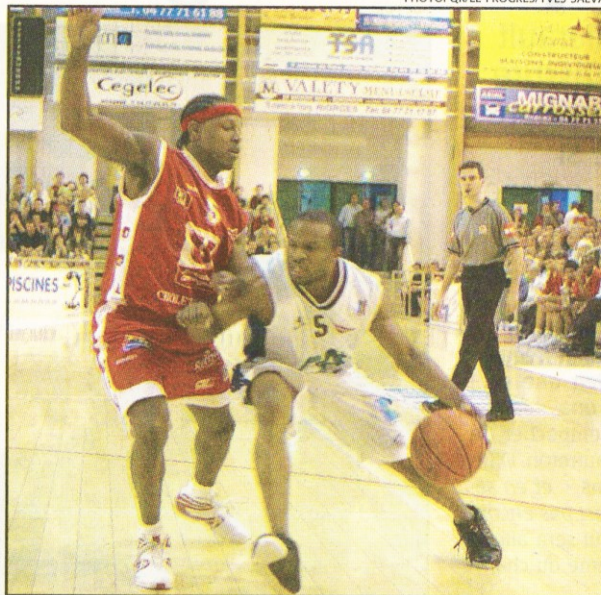
Le duel des meneurs a tourné à l'avantage du Roannais Rich

Bilba répond à Spencer à 3 points dès l'entame du dernier quart, et Wilson toujours aussi