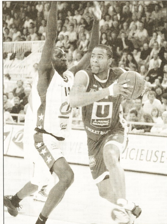
Marquis et les Choletais ont encore une marche à gravir afin d'accéder au play off

A deux journées de la fin, Cholet est proche du play off mais n'est pas encore mathématiquement assuré d'y participer. Il ne lui manque qu'un succès. Si celui-ci ne venait jamais (ce qui peut arriver à Hyères-Toulon puis face à Bourg), Cholet aurait tout de même une seconde chance. Le seul cas de figure qui conduirait en effet à son élimination passe par