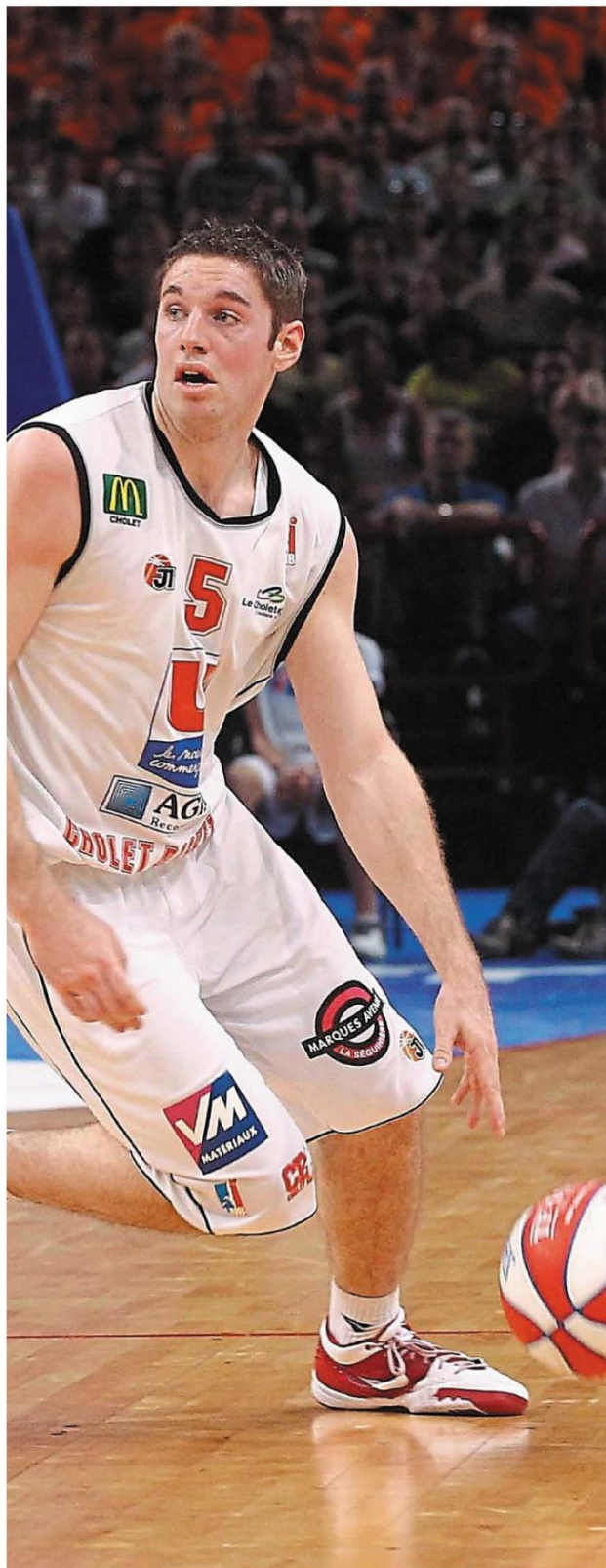
Le Brestois Fabien Causeur a joué à Cholet de 2009 à 2012.

Né le 16 juin 1987 à Brest ; 32 ans. 1,96 m ; 91 kg. Meneur - arrière. Clubs : Le Havre (2005-2009), Cholet (2009-2012), Saski Baskonia (Esp, 2012-2016), Brose (All, 2017-18), Real Madrid (Esp, depuis 2017). Sélections : 30 capes avec l'équipe de France. Palmarès : champion de France avec Cholet (2010), vainqueur de la Coupe d'Allemagne avec Brose (2017), champion d'Allemagne avec Brose (2017), champion d'Espagne avec le Real Madrid (2018, 2019), vainqueur de l'EuroLeague avec le Real Madrid (2018).