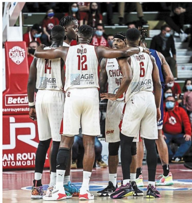
Restés solidaires même dans la tempête, comme ici pendant le money-time, les Choletais arrachent une victoire précieuse.

La première mi-temps surtout fut un modèle du genre. Agressifs en défense, maîtres du tempo et de leurs émotions, les Choletais conjuguèrent leur basket au plus que parfait : preuve en est, leur taux de réussite flirtait avec les 80 % pendant ces 10 premières