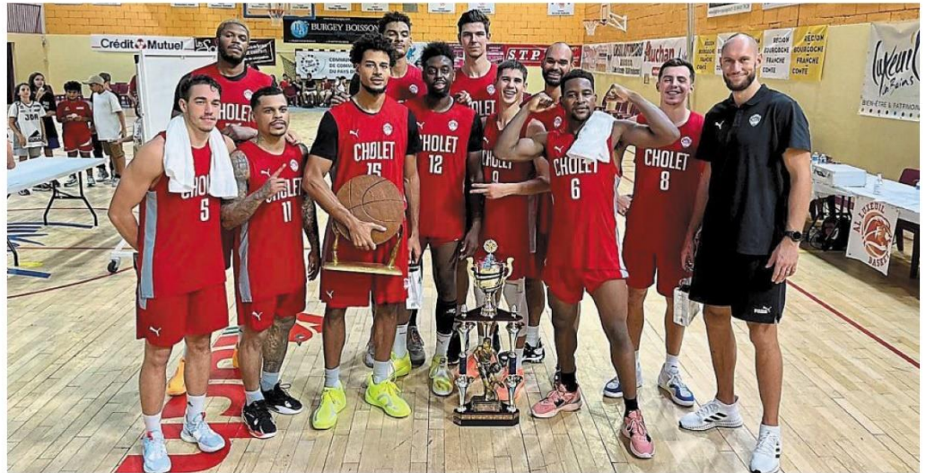
C'est déjà le troisième trophée pour Cholet Basket depuis le début de l'été !