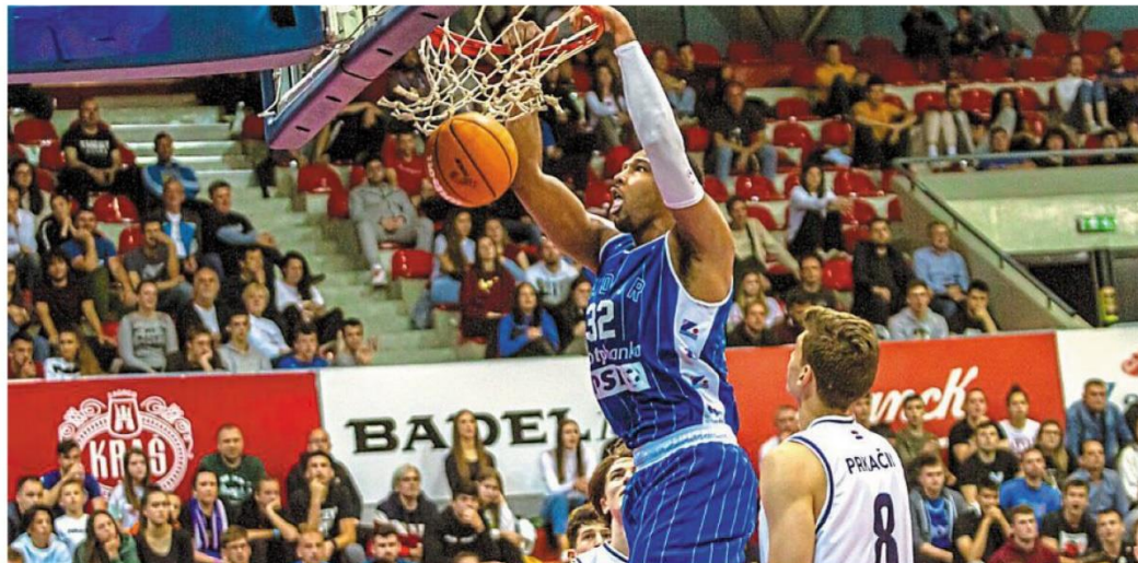
Le tournoi rassemble chaque année six équipes professionnelles.

Le tournoi de basket le plus ancien d'Europe soufflera ses bougies du 14 au 17 septembre.