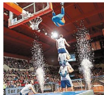
Les Barjots Dunkers.

À la salle Jean Bouin, Boulevard Pierre de Coubertin Toutes les infos détaillées sur les matchs et les tarifs sur : prostars.fr