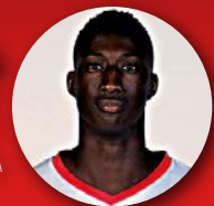
26 SY Pape Arrière/Ailier / 1,98 m 30 ans / FRA