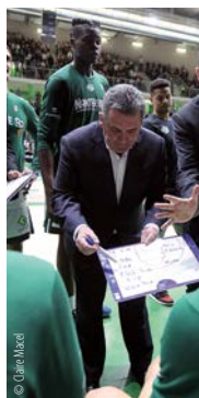
© J. B. M. / M. J.

Déjà, en 2013, on avait créé une surprise. Une vraie. Maintenant, c'est un peu le paradoxe de Nanterre : nous avons le 11 e budget de Jeep® ÉLITE (mais la 8 e masse salariale, ndr), les gens ne nous voient plus du tout comme une équipe de deuxième partie de