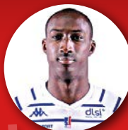
10 SY Pape Poste 2/3 - 2,00 m 31 ans / FRA