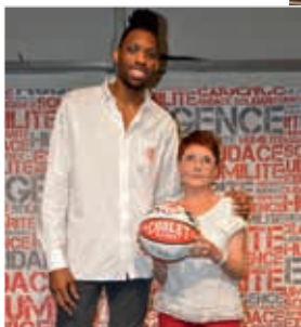
Concours de Pronostics Optifinance