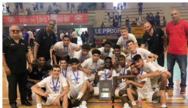
Champion de France Cadets 2018 (U18)