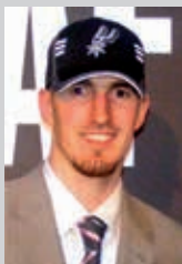
Nando DE COLO