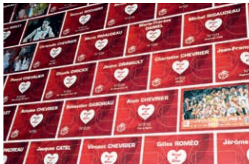
Les plaques des Membres Fondateurs installées à la Meilleraie

Cœur Rouge & Blanc lancera sa saison le jeudi 12 décembre lors d'une soirée de présentation au CBE.