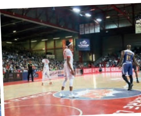
Panneaux LED 24 m - Ecrans géants Panneaux fixes