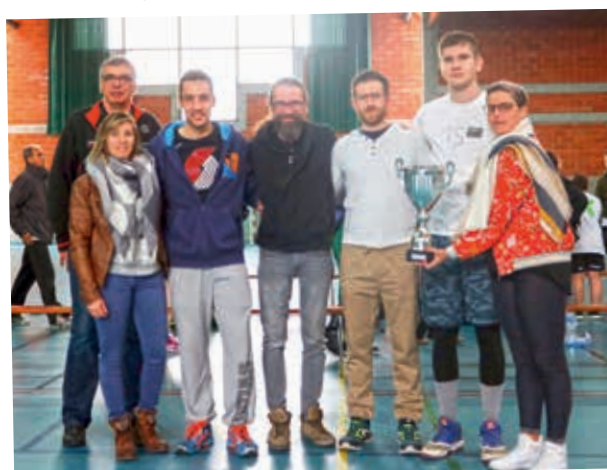
L'équipe DIXNEUF, vainqueur de la poule Eurocup du Tournoi des Sponsors 2019