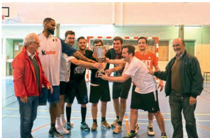
L'équipe ROUCHETTE, vainqueur du Tournoi des Sponsors 2019

Selon le nombre d'équipes participantes (22 la saison dernière), un tournoi sous forme de poules puis de phases finales est mis en place. C'est l'occasion pour tous les partenaires de CB de se rencontrer dans une ambiance amicale .