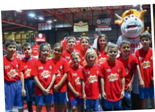
Parrainage des Escort Kids