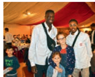
Rencontre avec les joueurs