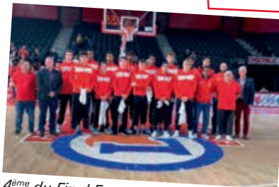
4 ème du Final Four 18/19