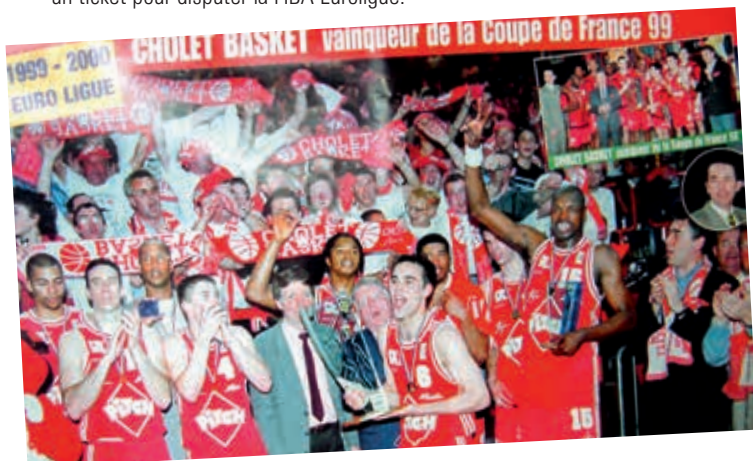
Coupe de France 1999