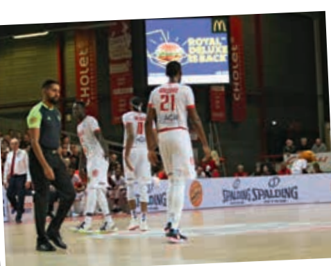
Tenues de match - Panneaux LED 36m Ecrans géants