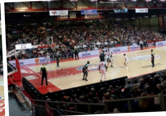
Panneaux LED but de basket - Banderoles Panneaux LED 36 m