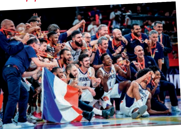
Équipe de France A

Retour sur les belles performances des anciens et actuels joueurs choletais présents en Équipe de France cet été.