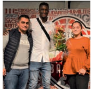
Remise de la composition florale réalisée par l'Atelier Vert

► Formule CBE Bronze : match en niveau 1 + cocktail dînatoire debout