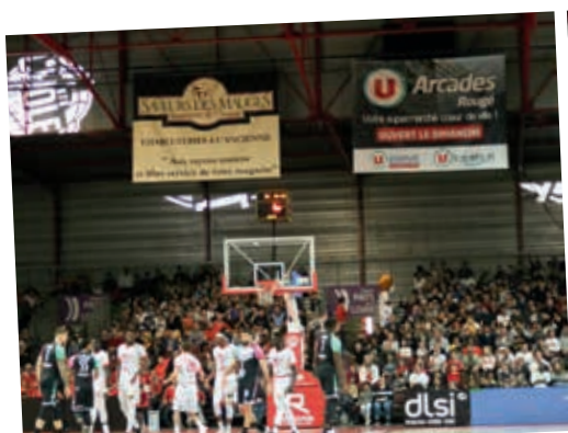
Banderoles - Protection de pieds de panier