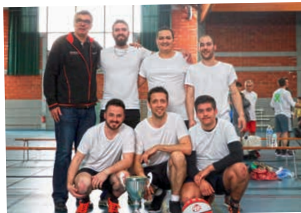
L'équipe CLARA AUTO, vainqueur de la poule Basketball Champions League du Tournoi des Sponsors 2019