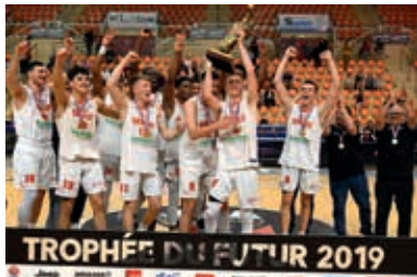
Vainqueurs du Trophée du Futur 2019