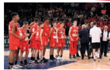
Finaliste de la Coupe de France U17