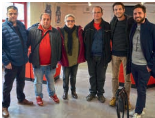
Une partie des membres du Conseil d'Administration

Cœur Rouge & Blanc est fière de compter un conseil d'administration de 9 personnes et plus de 150 membres actifs.