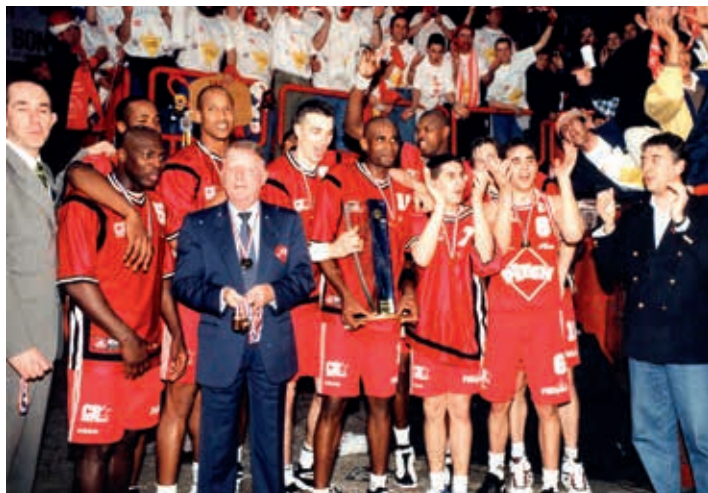
Coupe de France 1998