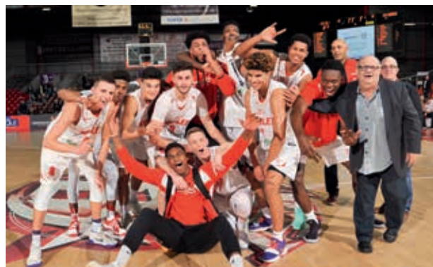
Champion de France Espoirs 2018 (U21)