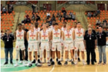
Champions de France 2019