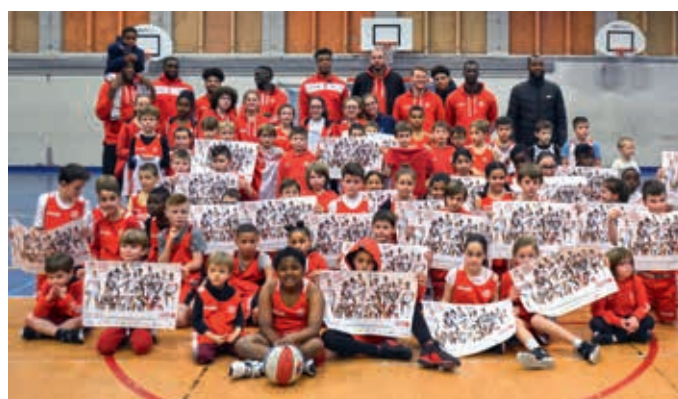
Entraînement de l'École de Basket avec les joueurs pros de CB.