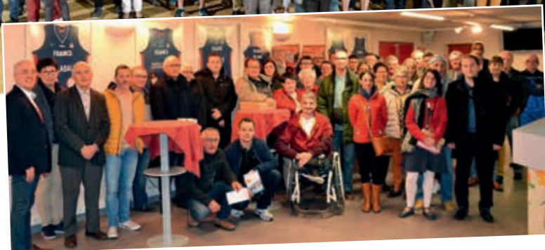
11 mars 2019 : remise des lots de la Soirée Abonnés Grand Supporter. Le 1 er lot est un voyage pour deux personnes offert par Richou Voyages.